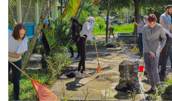
Campaña de Limpieza: Universidad contra el Dengue

De manera paralela, se avanzó en la atención de la salud mental, mediante la conformación de un equipo interinstitucional que elaboró y puso en marcha el Diagnóstico Institucional en Salud Mental y su plan de trabajo, priorizando la promoción, la orientación básica y la canalización oportuna de casos, con participación directa de estudiantes y docentes.