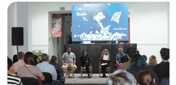
Evento «Cartas a Violeta» reflexionando sobre el acoso sexual y hostigamiento sexista

A partir del primer trimestre de 2026, se impulsó la jornada de Sensibilización LGBTTTIQA+ contra la violencia y discriminación en la UAN, la cual inició su recorrido en el nivel medio superior, cubriendo, en una primera etapa, el 62% de este nivel educativo. Esta acción, permitió ampliar el alcance preventivo de las estrategias formativas institucionales y acercar a la comunidad estudiantil herramientas de reflexión, reconocimiento y respeto a la diversidad sexo-genérica, contribuyendo de manera directa al fortalecimiento de entornos universitarios más informados, incluyentes, respetuosos y libres de violencia.