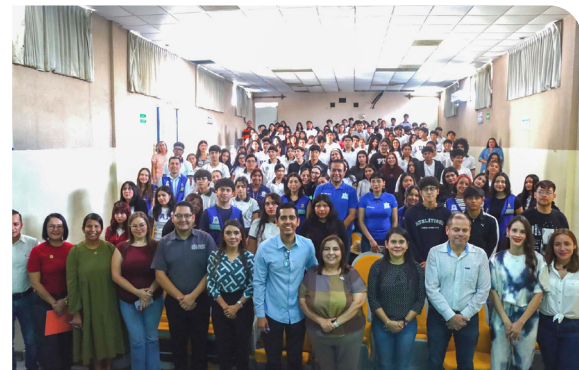
Primera Jornada de Universidad Saludable

Este esfuerzo se vio reforzado con herramientas prácticas y reflexivas desarrolladas durante la primera Jornada de Universidad Saludable, en la cual se llevaron a cabo diversas acciones de promoción de la salud vinculadas con el deporte y la identificación de talentos deportivos, la salud mental, la salud nutricional y la salud bucodental, contando con la participación directa de 1 792 estudiantes.