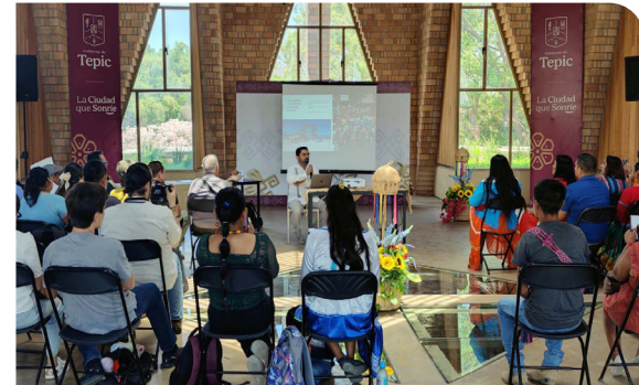
Conferencia «El catálogo de lugares sagrados en El Gran Nayar: una experiencia de antropología aplicada»

Este programa esta encauzado a generar una política institucional de atención a la diversidad, por ello, en función de las atribuciones de la Coordinación del Centro de Estudios en Lenguas y Culturas Indígenas de Nayarit CELINAY, se ha trabajado en lo relativo a la investigación, documentación y difusión de lenguas y culturas indígenas. Lo anterior, mediante diversas jornadas, actividades de difusión y divulgación, vinculación, proyectos de investigación, actividades de formación, convenios, así como, el seguimiento a las actividades enmarcadas en el acuerdo de colaboración existente con la Red para el Fortalecimiento de las Lenguas Indígenas de Nayarit (Red FOLINAY).