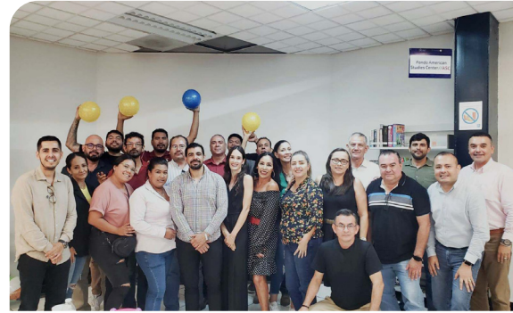
Taller «TEAcompañó, un camino a la inclusión»

Adicionalmente, se desarrolló la conferencia-taller TEAcompañó un camino a la inclusión , orientada a fortalecer la inclusión educativa y la atención a la diversidad, mediante herramientas, estrategias y técnicas que fortalezcan el quehacer académico, buscando sensibilizar y capacitar a docentes y administrativos sobre las neurodivergencias que pueden presentarse entre estudiantes del nivel medio superior, además de promover una comprensión profunda de las condiciones que se desarrollan en las escuelas.