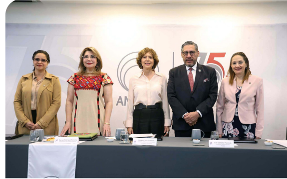
Conmemoración del 75 aniversario de la ANUIES