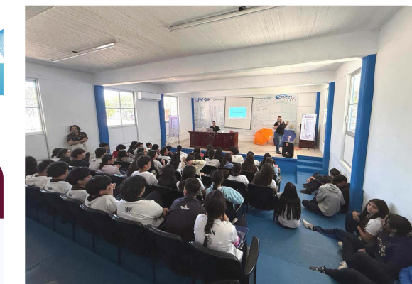
Jornada de capacitación y sensibilización en materia de protocolo, género y violencias 2026

El objetivo en el que se encausa este programa, es acerca de institucionalizar la perspectiva de género a fin de que permita disminuir las brechas de desigualdad en la universidad, por lo que, a través de la Ventanilla de Atención al Protocolo de Violencia de Género, se llevaron a cabo acciones de prevención, formación, difusión y divulgación sobre perspectiva de género, violencia, mujeres, diversidad sexo – genérica, derechos humanos, y salud sexual y reproductiva. A través de estas actividades se logró compartir 40 capacitaciones y talleres con estudiantes en diversas unidades académicas, 12 con dependencias, 19 con enlaces de género y 37 programas de radio, así como, la participación en materia de consejería en salud sexual, menstrual y reproductiva dirigida a la comunidad universitaria.