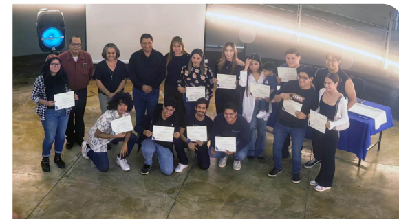
Entrega de constancias a estudiantes y docentes del proyecto COIL «Perfil docente desde una perspectiva intercultural»

De igual manera, se ha buscado consolidar oportunidades de participación en iniciativas internacionales para estudiantes y docentes, impulsando el posicionamiento institucional como referente académico y cultural a nivel nacional e internacional. Entre estos logros, destaca la creación y aplicación del examen general de habilidades lingüísticas, utilizado como apoyo y requisito para programas de posgrado; la instalación de la Comisión institucional de Internacionalización como instancia articuladora de esfuerzos; la implementación del proyecto COIL (Collaborative Online International Learning); el impulso del Programa de Adquisición de Lenguas Extranjeras dirigido a la comunidad universitaria (PRADLEX), en donde se involucraron 860 integrantes de la misma, ofertando cursos de extensión en lenguas extranjeras aproximadamente a 3 000 participantes. En el ámbito de la formación académica y la internacionalización, se realizó el Primer Congreso Internacional de Lenguas Extranjeras (CILEX UAN 2025), que reunió a 275 participantes y 34 especialistas.