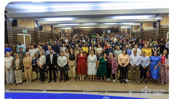
Primer Congreso Internacional de Lenguas Extranjeras (CILEX UAN 2025)

Paralelamente, se fortaleció la presencia institucional a nivel nacional mediante la participación activa en la Secretaría Técnica de la Red de Cooperación, Movilidad e Intercambio de la región Centro-Occidente de ANUIES, lo que permitió articular esfuerzos interinstitucionales en materia de movilidad, cooperación y difusión.