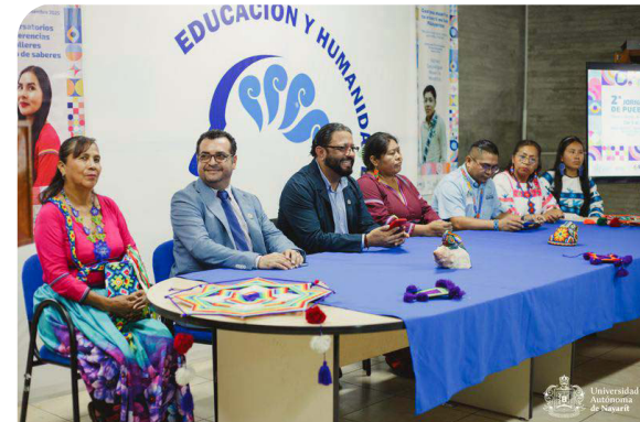
Segunda Jornada Universitaria de Pueblos Originarios

campaña de difusión multilingüe, en lengua wixárika (huichol), lengua náayeri (cora) y en español. La jornada se organizó en dos bloques; el primero con enfoque académico, en donde se realizaron conversatorios y conferencias magistrales con temáticas acerca de pueblos originarios, impartidos por especialistas de distintas universidades del país; y el segundo, orientado hacia lo cultural y didáctico, que incorporó talleres de arte, lengua y cultura de pueblos originarios y diversidades.