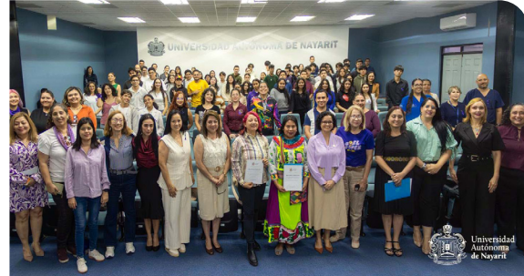
Panel «¿Qué nos falta? Derechos, acciones y justicia para las mujeres»

En el marco del Día Internacional de la Mujer, se realizaron actividades conmemorativas que incluyeron expresiones artísticas y espacios de reflexión sobre igualdad y derechos de las mujeres. Asimismo, se impartieron cursos sobre masculinidades positivas dirigidos al personal educativo.