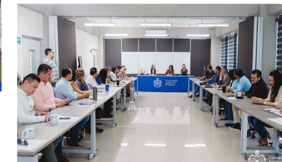
Instalación de la Comisión Institucional a lo Largo de la Vida

Esta iniciativa representa una alternativa para la diversificación y el fortalecimiento de la oferta formativa, al responder a las necesidades del entorno y a las demandas curriculares; aspecto que es atendido desde los planes y programas educativos, la vinculación profesional, el acompañamiento docente, así como la atención de la comunidad estudiantil en nivel medio superior, superior y posgrado, lo que articula un trabajo coordinado entre el secretariado universitario.