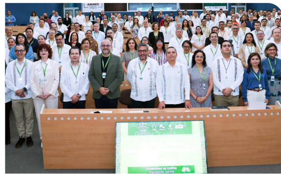
LXVII Sesión Ordinaria de la Asamblea General de la ANUIES

En este sentido, la UAN mantiene una presencia activa en 17 redes de la ANUIES, lo que ha permitido la profesionalización de los procesos internos y el intercambio de mejores prácticas en diferentes áreas. La presencia de la UAN se extiende a la toma de decisiones en políticas públicas a nivel nacional y estatal, mediante la participación de directivos y docentes especialistas en temáticas, lo que garantiza que la experiencia académica y técnica se traduzca en beneficios tangibles para la sociedad nayarita.