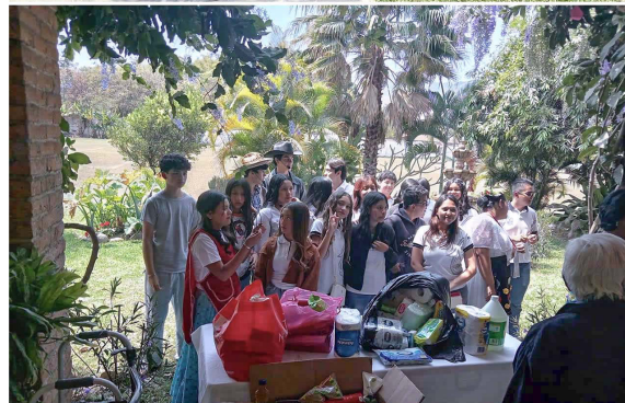
Visita al asilo «Hermoso Atardecer» por alumnos de U.A. Preparatoria No. 1