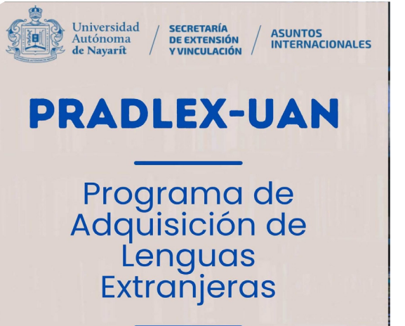
Convocatoria a PRADLEX-UAN