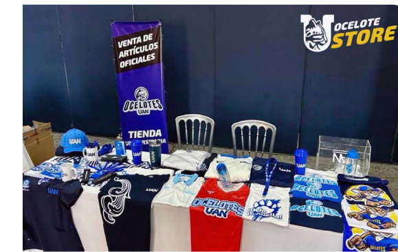
Productos oficiales marca universitaria

Por otro lado, con la finalidad de buscar un mayor posicionamiento de la identidad universitaria, se llevó a cabo un ordenamiento administrativo y normativo para el uso y explotación de la marca universitaria en productos identitarios.