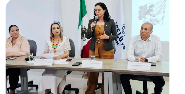
Taller «Proceso de Autoevaluación Institucional» con los integrantes del COEPES-Nayarit

estatales a partir del conocimiento y experiencia con el que cuenta la comunidad académica.