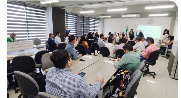
Taller «Proceso de Autoevaluación Institucional» con los integrantes del COEPES-Nayarit

de la Educación Superior (CONACES); del Sistema de Evaluación y Acreditación de la Educación Superior (SEAES); y del Programa de Investigadoras e Investigadores por México.