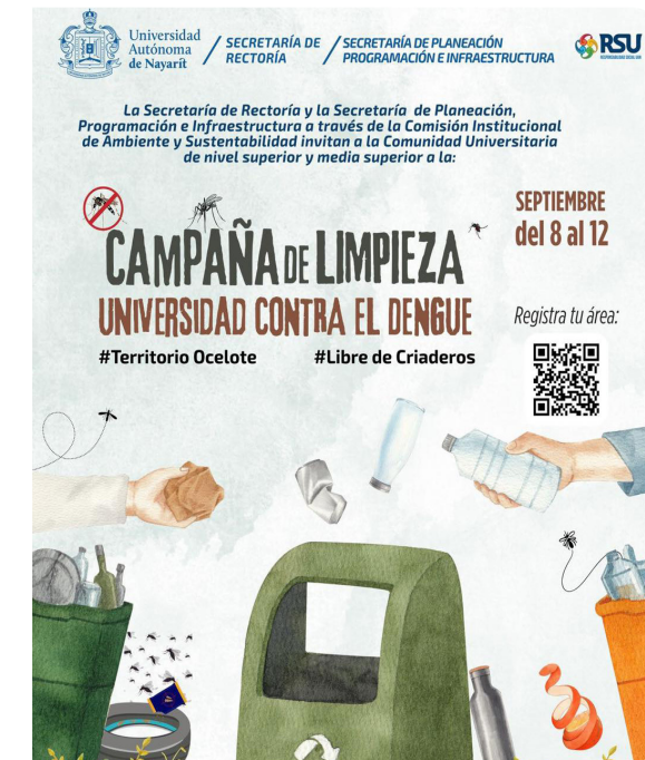
Campañas de Limpieza contra el Dengue

En el ámbito de Universidad Saludable, se impulsaron estrategias de cuidado ambiental, gestión de residuos, vigilancia epidemiológica y promoción de estilos de vida saludables, articuladas con campañas de limpieza, vacunación y capacitación a prestadores de servicios de alimentos, contribuyendo a generar entornos universitarios más seguros, sostenibles y saludables.