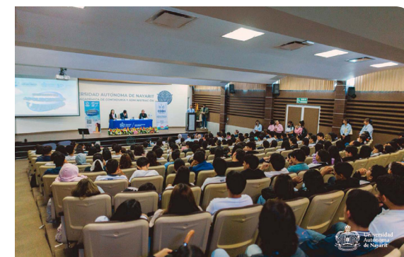
Congreso de las Juventudes y Adolescencias en Movimiento

En este sentido, en coordinación con la Comisión de Defensa de los Derechos Humanos del Estado de Nayarit, se realizó el Congreso de Juventudes y Adolescencias en Movimiento, que tuvo como sede algunas de las unidades académicas preparatorias y cuyo arranque fue en el Campus Tepic. En este, se llevaron a cabo acciones encaminadas a la promoción y defensa de los derechos humanos, mediante talleres y pláticas con el estudiantado, propiciando reflexiones sobre derechos humanos, igualdad de género y prevención de adicciones. Además, se impartieron talleres sobre ciudadanía digital, uso responsable de redes sociales, salud mental y participación ciudadana, dirigidos a estudiantes de distintas preparatorias.