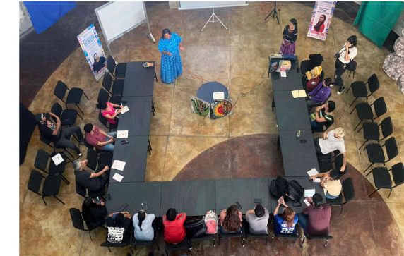
Taller de Lengua y Cultura Wixárika

Estas acciones, no solo garantizan el acceso, sino que visibiliza la diversidad cultural como un valor institucional y fortalece el compromiso de la universidad con la equidad territorial y el respeto a los derechos de los pueblos originarios.