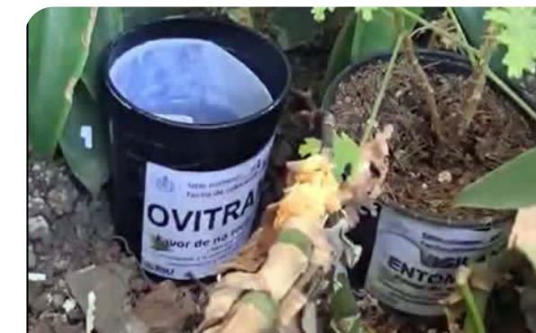
Instalación de ovitrampas

Preventivos y Control de Enfermedades (CENAPRECE). Los resultados del monitoreo, han sido fundamentales para identificar la correlación entre las acciones de limpieza y descacharrización y la disminución del índice de huevecillos encontrados por determinado periodo de medición.