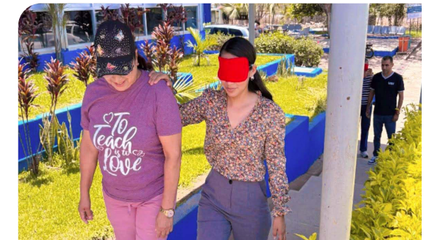
Taller «Braille y Tiflotecnologías» en la U.A. Preparatoria No. 1

En el ámbito de la inclusión funcional, el taller de Braille y Tiflotecnología impartido a 43 docentes y 79 estudiantes en la Sala Tiflotécnica, responde a políticas de capacitación y concientización sobre diversidades, al formar a la comunidad con herramientas de accesibilidad, se genera una cultura institucional más sensible y preparada para acompañar trayectorias escolares diversas, indispensable para una verdadera responsabilidad social.