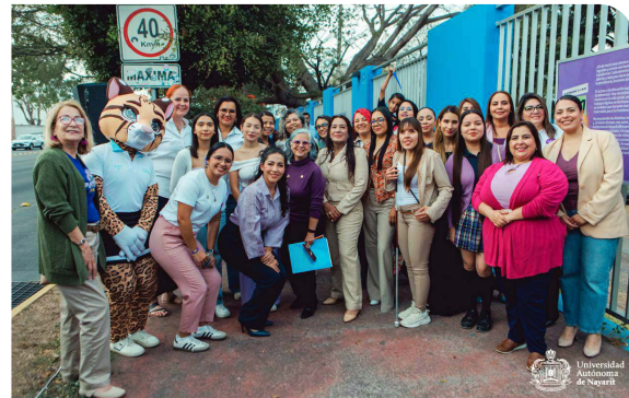
Exposición fotográfica «Por Todas Para Todas»

Adicionalmente, se desarrolló la conferencia-taller TEAcompañó un camino a la inclusión , orientada a fortalecer la inclusión educativa y la atención a la diversidad, mediante herramientas, estrategias y técnicas que fortalezcan el quehacer académico, buscando sensibilizar y capacitar a docentes y administrativos sobre las neurodivergencias que pueden presentarse entre estudiantes del nivel medio superior, además de promover una comprensión profunda de las condiciones que se desarrollan en las escuelas.