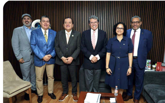
Reunión de trabajo con diputadas y diputados integrantes de la Comisión de Presupuesto y Cuenta Pública de la Cámara de Diputados