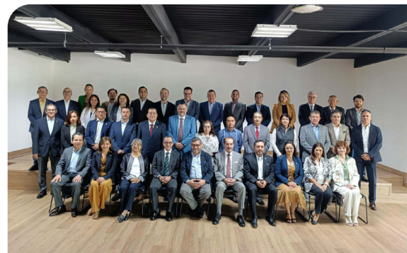
Segunda sesión ordinaria del Consejo Nacional de la ANUIES

Ejemplo de ello, es la participación activa en la Red de Asuntos Estudiantiles y en la Red de Cooperación, Intercambio y Movilidad, participando activamente en las discusiones y actividades de la agenda de trabajo, lo que ha permitido incorporar ajustes en los procesos internos de la institución y mejorar la visión de trabajo.