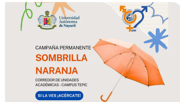
Jornada por una Vida Libre de Violencia en el marco del Día Naranja

En el mismo sentido, a través de la Comisión Especial Permanente de Responsabilidades y Sanciones de Violencia de Género en coordinación con la Ventanilla de Atención, ha permitido no solo la socialización efectiva del Protocolo , sino también, el fortalecimiento progresivo de la confianza institucional en los mecanismos de atención; situación que ha impactado en el incremento del número de denuncias, lo que no debe interpretarse como un aumento de la violencia, sino como un indicador de mayor acceso, credibilidad y disposición de la comunidad universitaria para hacer uso de las vías institucionales, el fortalecimiento de la cultura de la denuncia, así como de la capacidad de esta comisión para atender, analizar y sustanciar los casos con mayor rigor técnico y sentido de protección de derechos.