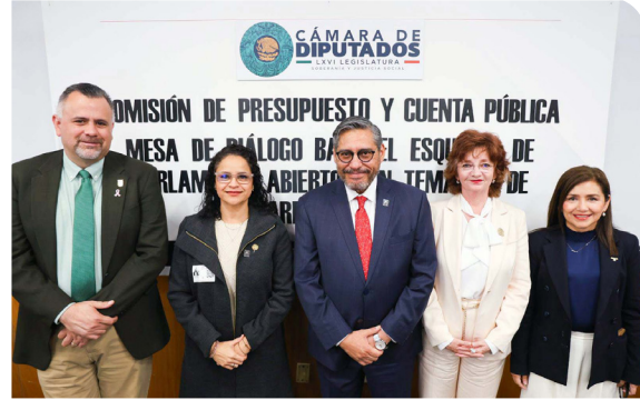
Parlamento abierto, en la mesa de diálogo «Desarrollo Social»

El año 2025, representó el primer año de la Universidad al frente de la Presidencia del Consejo Regional Centro-Occidente de la Asociación Nacional de Universidades e Instituciones de Educación Superior (ANUIES). Esta responsabilidad consolida el liderazgo académico en la región, y otorga a la institución una voz privilegiada en la definición de la agenda de educación media superior y superior a nivel nacional. Desde la ANUIES se ha participado en la estrategia de gestión directa ante las instancias federales, logrando canalizar las necesidades regionales e institucionales.