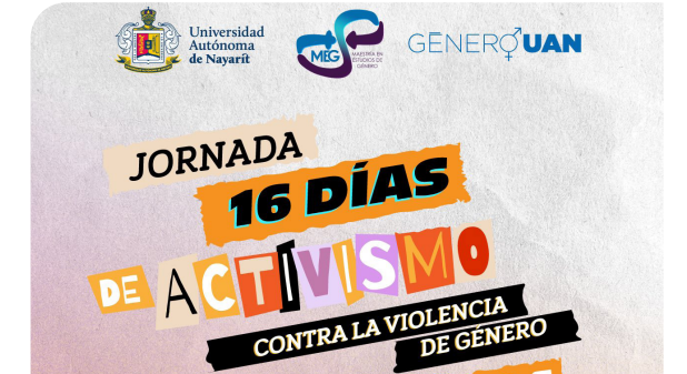
Jornada 16 días de activismo contra la violencia de género

A partir del primer trimestre de 2026, se impulsó la jornada de Sensibilización LGBTTTIQA+ contra la violencia y discriminación en la UAN, la cual inició su recorrido en el nivel medio superior, cubriendo, en una primera etapa, el 62% de este nivel educativo. Esta acción, permitió ampliar el alcance preventivo de las estrategias formativas institucionales y acercar a la comunidad estudiantil herramientas de reflexión, reconocimiento y respeto a la diversidad sexo-genérica, contribuyendo de manera directa al fortalecimiento de entornos universitarios más informados, incluyentes, respetuosos y libres de violencia.