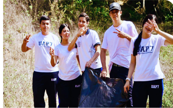
Jornada Nacional de Tequios por la Tierra y Murales Mundialistas

Respecto a las acciones emprendidas, se ha mejorado el proceso de comunicar de manera eficaz al interior y al exterior, las normativas y buenas prácticas que se gestan en la universidad, marcando una agenda de trabajo diario que implica articular y armonizar proyectos, que permitan un desahogo eficiente en la atención de sus necesidades, así como, detectar necesidades de formación de la comunidad directiva para mejorar sus prácticas de gestión.