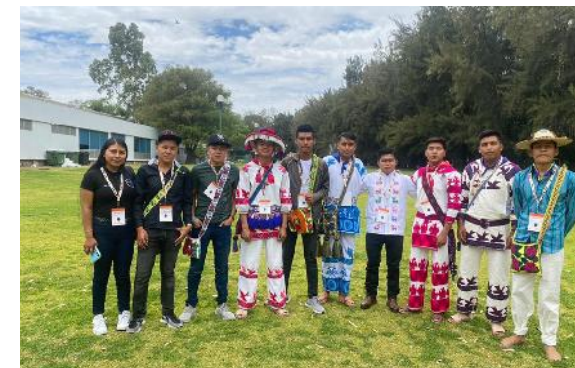
Encuentro Internacional de Estudiantes de Pueblos Originarios "Fortalecer identidades dentro de las diversidades", en la Universidad de Guadalajara

Finalmente, con el propósito de ofrecer un espacio para la reflexión e intercambio de ideas en torno al reto de ser universitario desde la perspectiva de estudiantes de pueblos originarios, 2 docentes y 15 estudiantes de diferentes carreras de la UAN, representaron a Nayarit en el Encuentro Internacional de Estudiantes de Pueblos Originarios Fortalecer identidades dentro de las diversidades; llevado a cabo en la Universidad de Guadalajara.