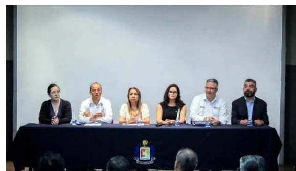
Talleres de Autoevaluación Institucional, Coevaluación, Evaluación Formativa y Diagnóstica

Actualmente se trabaja en la Autoevaluación del Sistema Estatal de Educación Superior, en conjunto con otras instituciones públicas y privadas de Nayarit.