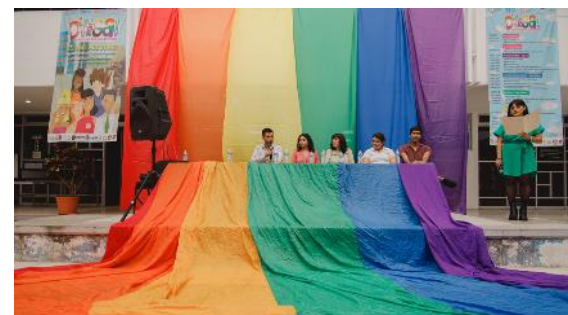
Foro Académico y Cultural LGBTQ+ Diversa: Diversidad en la Universidad

aisladas, destaca el Segundo Foro Académico y Cultural LGBTQ+Diversa: Diversidad en la Universidad, evento con valor curricular en el rubro II, organizado por las Unidades Académicas de Ciencias Sociales, Educación y Humanidades, Contaduría y Administración, Ciencias Químico Biológicas y Farmacéuticas, Medicina y Derecho. A partir de las actividades que conformaron el foro, se reflexionó sobre la visibilización de la diversidad, las identidades y expresiones de género, desde el respeto y el compromiso institucional con la nula tolerancia a las violencias.