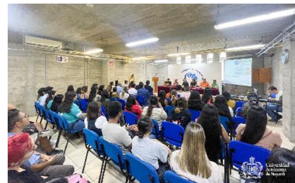
Primer Festival Inter-Cultural "Gran Nayar"

En el marco del Día Internacional de la Lengua Materna y Plan de Acción de México para el Decenio Internacional de las Lenguas Indígenas 2022-2032, se efectuó una firma y ratificación de convenio de la Red para el Fortalecimiento de las Lenguas Indígenas de Nayarit (FOLINAY), con el objetivo de reconocer los derechos lingüísticos en la vida pública y comunitaria de los pueblos indígenas del estado.