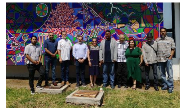
Restauración de murales

Se llevó a cabo la recuperación y restauración de elementos de gran valor identitario, que forman parte del patrimonio universitario, como son los murales , obras de arte que reflejan el legado cultural e histórico de la UAN.