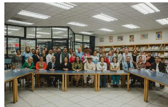
Firma y ratificación de convenio Red para el Fortalecimiento de las Lenguas Indígenas de Nayarit (FOLINAY)

Finalmente, con el propósito de ofrecer un espacio para la reflexión e intercambio de ideas en torno al reto de ser universitario desde la perspectiva de estudiantes de pueblos originarios, 2 docentes y 15 estudiantes de diferentes carreras de la UAN, representaron a Nayarit en el Encuentro Internacional de Estudiantes de Pueblos Originarios Fortalecer identidades dentro de las diversidades; llevado a cabo en la Universidad de Guadalajara.