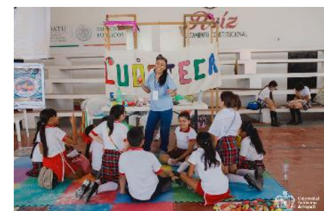
Brigadas universitarias en escuelas de nivel básico