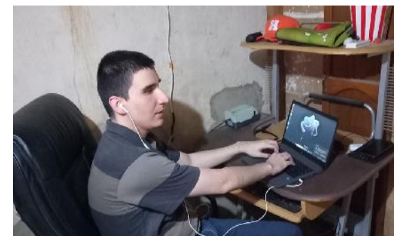
Alumno con discapacidad de la carrera Licenciatura en Derecho en modalidad virtual

En la UAN, nos basamos en el respeto e igualdad de oportunidades para todas las personas, sin ningún tipo de discriminación.