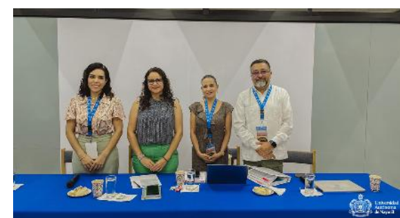
Reunión Cumbre de Alta Dirección de Instituciones de Educación Superior (IES) de la ANUIES Región Centro Occidente

Con la finalidad de desarrollar un proyecto institucional para la procuración de fondos, se participó en el diplomado del mismo nombre, en colaboración con Santander Universidades,