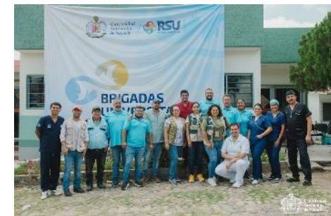
Equipo de brigadas universitarias