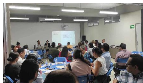
Talleres de Autoevaluación Institucional, Coevaluación, Evaluación Formativa y Diagnóstica

La participación de nuestra Institución en dicho proceso generará reflexiones y recomendaciones para emprender mejoras en todos los procesos y prácticas que se desarrollen, de igual manera se promoverá la articulación de funciones con los planteamientos que la política nacional propone.