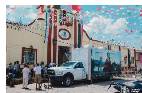
Brigadas universitarias en municipio del Estado