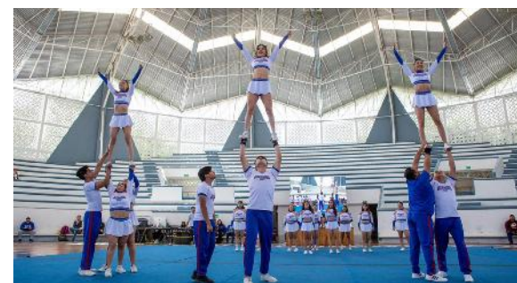
Participación de la Porra Ocelotes UAN en el Festival de la Identidad Universitaria

Como parte del festival, los estudiantes disfrutaron de una intervención musical por parte de la banda de rock universitaria Galletas de Animalitos, la presentación del Ballet Mahuatzi y la Porra Ocelotes UAN y en atención a los estudiantes de nuevo ingreso pertenecientes a pueblos originarios, se les dio información en lengua Náayeri y Wixárika por parte de los profesores adscritos al Centro de Lengua y Cultura Indígena de Nayarit, perteneciente a la UAN.