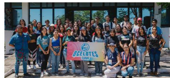
Alumnos de nuevo ingreso en el Festival de la Identidad Universitaria

Se llevó a cabo la recuperación y restauración de elementos de gran valor identitario, que forman parte del patrimonio universitario, como son los murales , obras de arte que reflejan el legado cultural e histórico de la UAN.