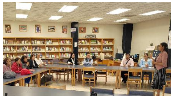
Reunión de los responsables de Proyectos de Colaboración Universitaria

como resultado, se contó con el registro de 9 proyectos escolares comunitarios que contemplan actividades para el mejoramiento de la comunidad.