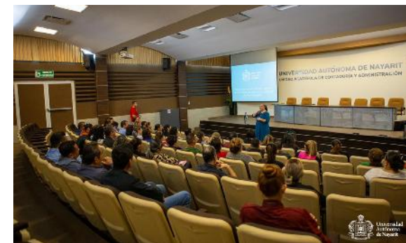
Difusión del Protocolo de Prevención, Atención y Sanción de Violencia de Género de la UAN

La UAN en el 90% de las Unidades Académicas y Dependencias Universitarias, estableciéndose rutas de atención e incorporación del personal con formación jurídica y legal en el tratamiento de expedientes y casos.