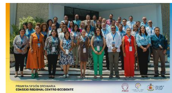
Reunión Cumbre de Alta Dirección de Instituciones de Educación Superior (IES) de la ANUIES Región Centro Occidente

Recientemente, la Institución fue sede de la Reunión Cumbre de Alta Dirección de Instituciones de Educación Superior (IES) de la ANUIES Región Centro Occidente, donde 33 IES abordaron las problemáticas más apremiantes de la educación superior a nivel nacional y regional. Con este tipo de acciones se construyen alianzas para el desarrollo del país.